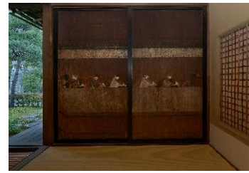
杉戸絵 人形廻しや立花など当時の文化芸能がうかがえます

各回15名様まで ※先着順要事前予約 所要時間50分程度 お1人様1,500円（税・入園料込） ※希望日時は第二希望まで明記しメール・FAXでお申込みください。 ※5/3, 5/26, 6/1, 6/5, 6/24, 6/28は④14:00～の開催もあり