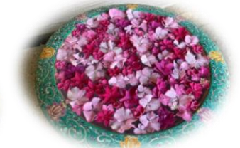
季節のお花を浮かべた花手水 写真は昨年の様子です