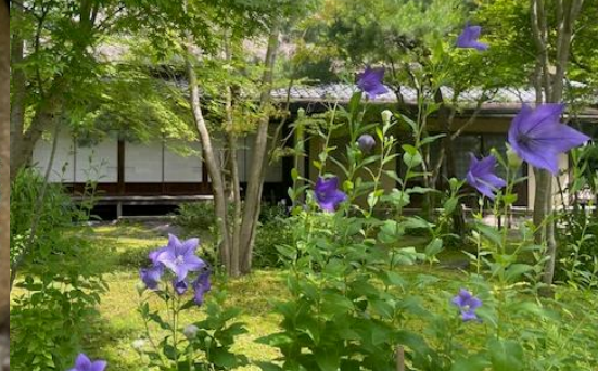
写真は昨年の様子です